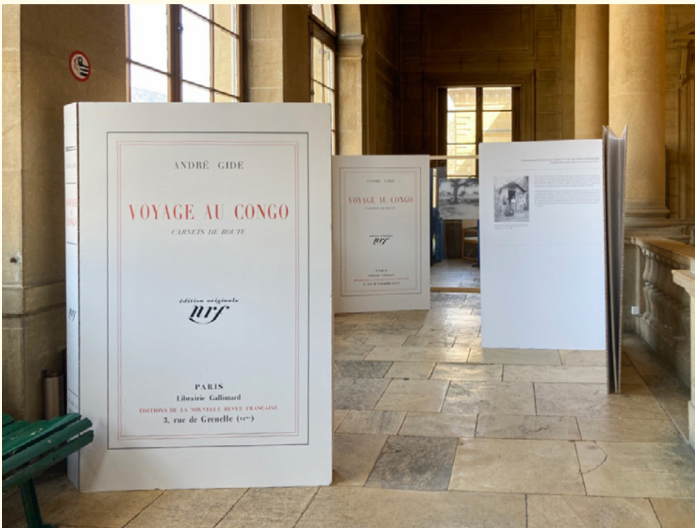
📌 «André Gide et l'Afrique équatoriale française»: une exposition invitant à se questionner sur notre rapport aux autres.

Réseaux sociaux: le piratage informatique qui a mis à mal notre principal outil de travail n'aura pas découragé l'équipe en charge de la communication Facebook. Même privée d'ordinateurs et de connexion internet, celle-ci est parvenue à réaliser cent-soixante-trois publications en 2022. Le nombre d'abonné-e-s atteint désormais mille-huit-cent-sept personnes.