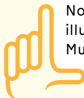
☞ Menu sur soie du 8 août 1905, signé Mucha

Un très rare menu tissé sur soie vient enrichir les collections gastronomiques de la BPUN. Réalisé à l'occasion du Congrès National des Sociétés de Géographie, tenu à Saint-Etienne le 8 août 1905, le document est orné d'un magnifique motif Art Nouveau signé par le célèbre illustrateur tchèque Alphonse Mucha (1860-1939).