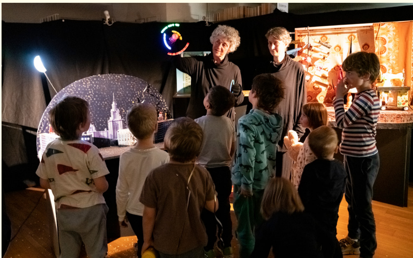
👉 On a décroché la lune avec les marionnettes la Turlutaine lors du BiblioWeekend 2022

Après deux ans d'interruption, le week-end des bibliothèques, organisé désormais dans tout le pays sous le nom de BiblioWeekend, s'est tenu en mars sur le thème «Décrocher la lune». Une palette d'événements (goûter pour les enfants, visites, présentation de livres rares, conférence, bricolage céleste, café-concert) a permis à un public de tous âges d'expérimenter la Bibliothèque et de découvrir le bâtiment et ses précieuses collections dans une atmosphère diaphane.