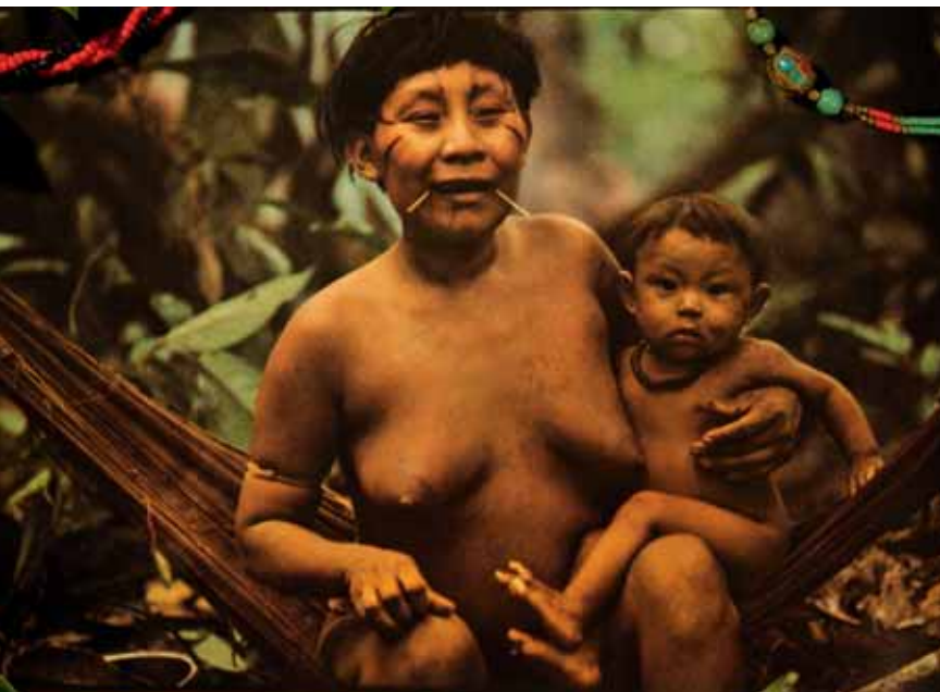
Amazônia, de la photographe Claudia Andujar, native de Neuchâtel : un combat pour défendre le peuple Yanomami d'Amazonie.