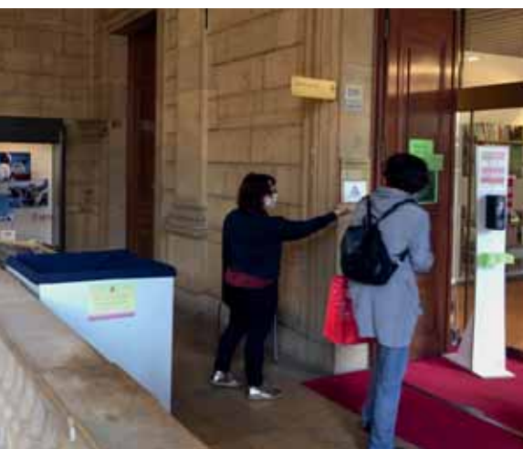
Un accueil personnalisé pour se sentir en sécurité.