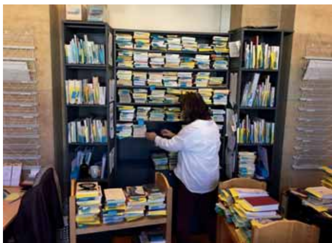
Les réservations s'accumulent durant la période de confinement.

Durant les périodes de fermeture complète (du 16 mars au 9 mai et du 5 novembre au 18 décembre), les équipes ont continué à être présentes pour maintenir le contact avec les usagers et répondre aux nombreuses demandes : plus de 1'000 appels téléphoniques ont ainsi été réceptionnés, permettant à 542 lecteurs de venir retirer 1'763 documents au guichet de retrait mis en place pour l'occasion.