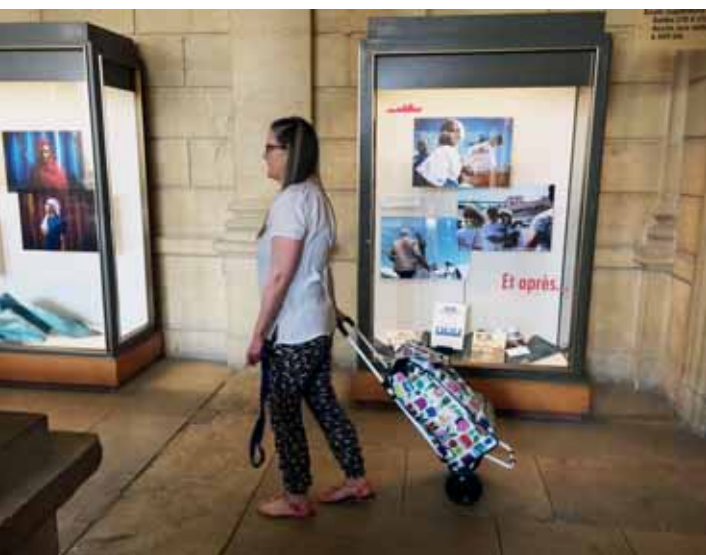
Une conséquence des mesures sanitaires : le catalogage à domicile.

Combien d'utilisatrices et d'utilisateurs nous ont dit leur reconnaissance d'avoir pu accéder à des services considérés pour certain.e.s comme une véritable bouée de survie. Si aucune raison ne permet de se réjouir vraiment de l'année écoulée, l'expérience fut aussi celle de formidables élans de solidarité et de créativité en faveur du bien commun. La BPUN y a contribué et compte poursuivre sur cette voie avec confiance et détermination.