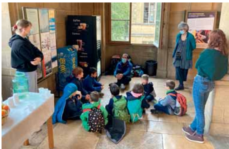
Une étape à la Bibliothèque pour découvrir l'herbier de Jean-Jacques Rousseau.