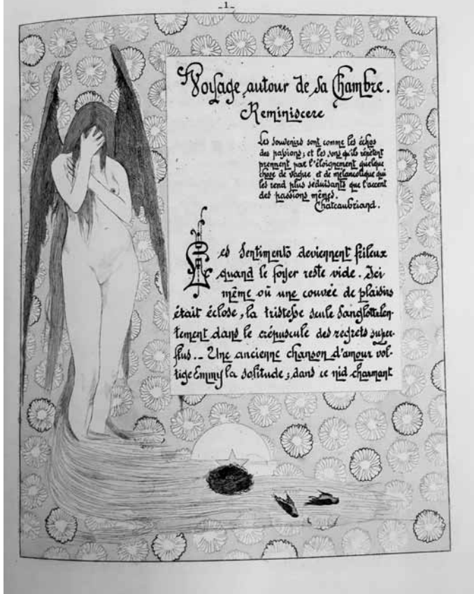
Le somptueux Voyage autour de sa chambre publié par O. Uzanne en 1896.