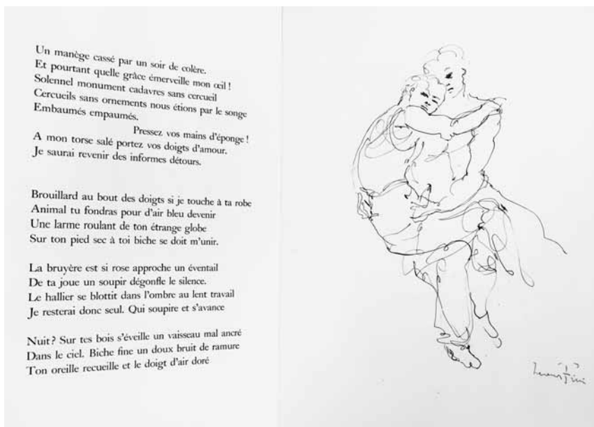
J. Genet, La galère , illustré par L. Fini, Paris, 1947.