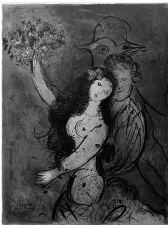
Lithographie originale de Marc Chagall illustrant le menu offert par le Général de Gaulle au couple royal de Suède en 1963.

100 eaux-fortes de Raphaël Freida; ex. no 1/12 exemplaires format in-4, texte réimposé, sur papier Japon avec 3 états des planches.