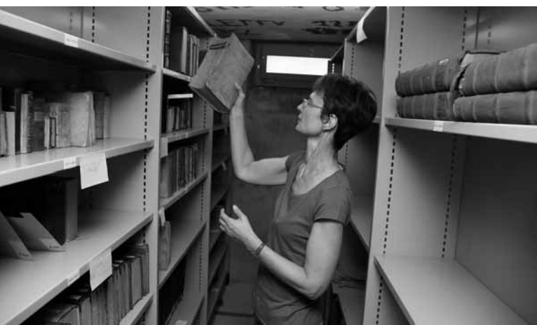
Analyse qualitative des documents par le Service des manuscrits de la BPUN.