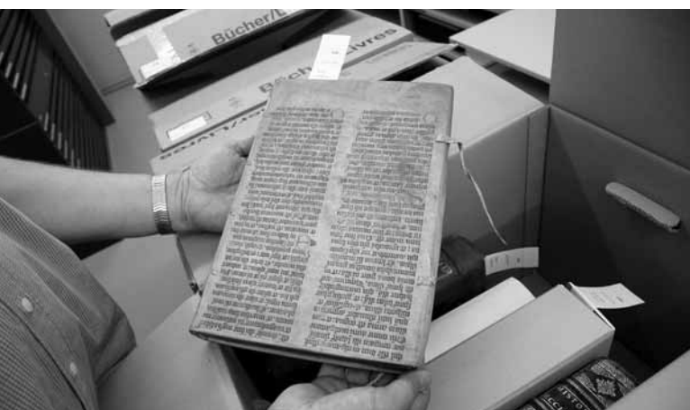
Conditionnement des documents pour le transport.