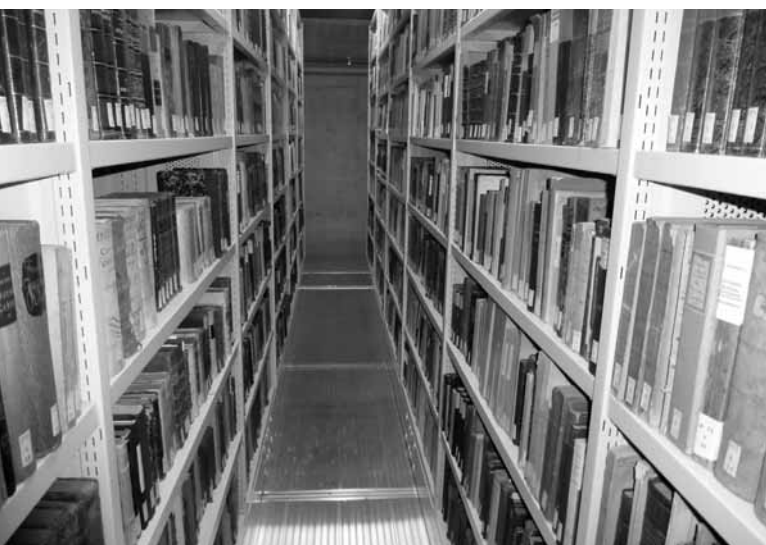
La Bibliothèque des Pasteurs nettoyée et conditionnée à la BPUN.