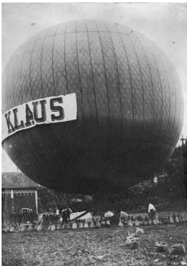
Première ascension du ballon «Chocolat Klaus» à Saint-Cloud, 1913.