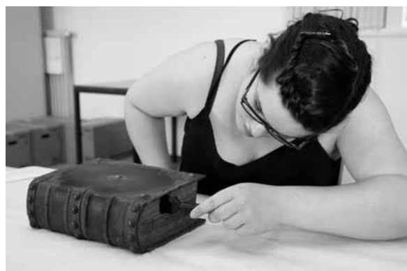
Nettoyage de documents précieux avant le déménagement.