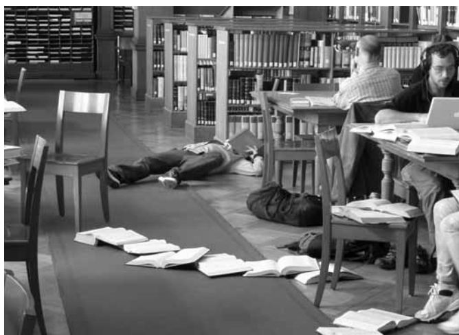
Fête de la danse 2015. Performance par la Compagnie Gilles Jobin en Salle de lecture.