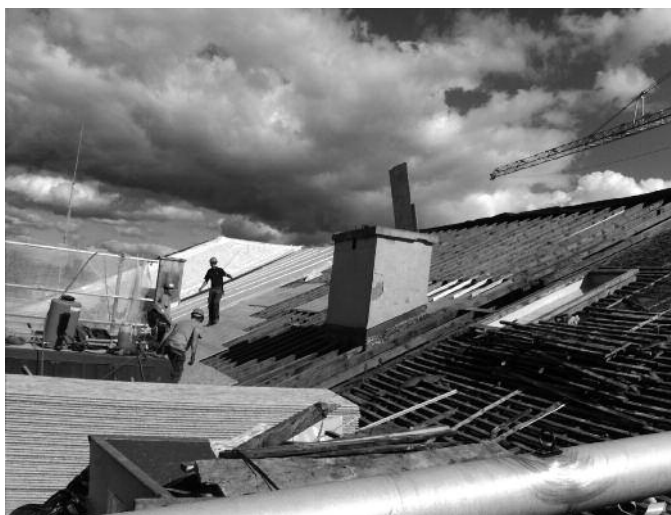
Rénovation de la toiture du Collège latin, septembre 2012.

La Bibliothèque continue par ailleurs à répondre aux demandes particulières des usagers et poursuit sa politique de numérisation des fonds patrimoniaux (voir le chapitre consacré au Service des manuscrits).