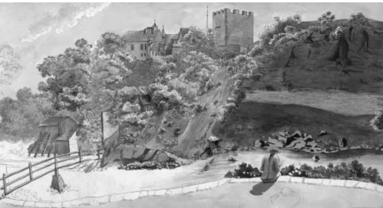
Louis Marval, A l'Ecluse, aquarelle, vers 1789, 21×30 cm.