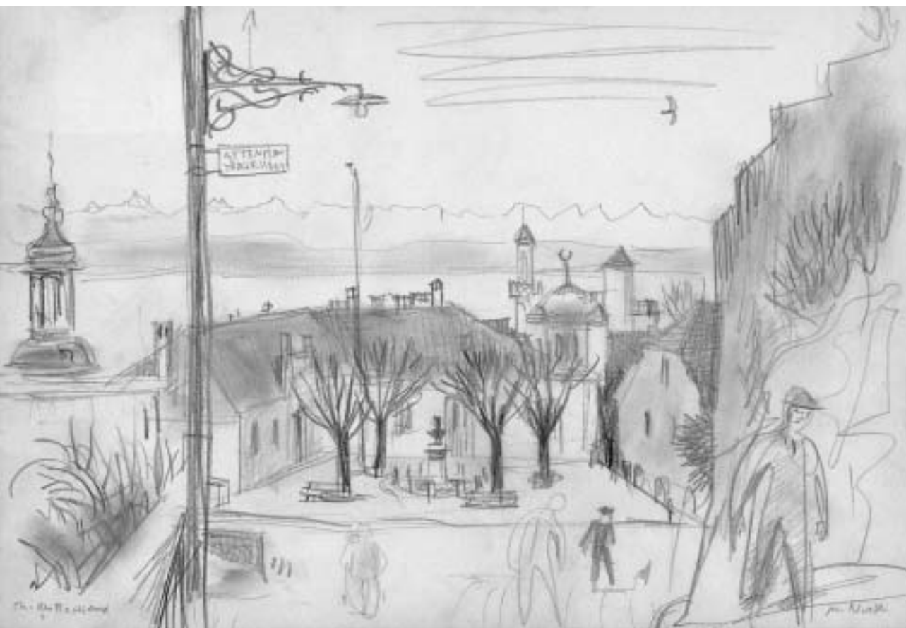
Marcel North, Chemin des Battieux, Serrières, dessin au crayon, 20,6×29,8 cm.