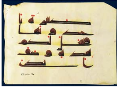
Coran, sourate XLVIII, 20. IXe-Xe siècles. Parchemin. BNF, Manuscrits orientaux (Arabe 350)